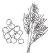
セラミド AP、セラミド NP