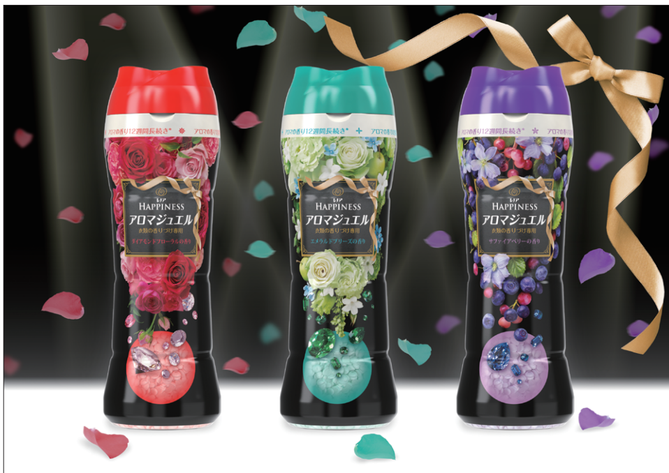
レノアハピネス アロマジュエル ダイヤモンドフローラルの香り レノアハピネス アロマジュエル エメラルドブリーズの香り レノアハピネス アロマジュエル サファイアベリーの香り

また、今回はフルーティ系の香りが新たに加わりました。これまでも人気のフレッシュ系、フローラル系、と合わせて人気の高い3つの香りで、より香水のような上質な香り体験をお届けします。 ※保管状態で