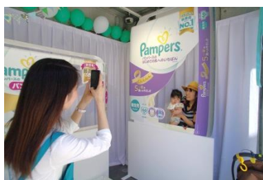
フォトブースではパンパースのパッケージになりきり、多くの参加者が記念撮影。

また、製品について体験、理解をいただくだけでなく、パンパースのパッケージ写真を撮影できるフォトブースや、2月の公開以来135万回以上再生されている、新製品の発売を記念したウェブムービー「キミにいちばん」( https://youtu.be/LsugKLnIxWg )も会場内で上映。参加者によりたくさんの、赤ちゃんにしてあげたいいちばんのことが書かれ、窓に掲示されました。