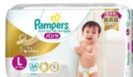
「パンパースの肌へのいちばん *1 パンツ」 サイズ：M、L、ビッグ