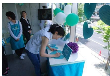
多くのお母様にご自身がしてあげたい「赤ちゃんにとってのいちばん」を書いていただきました。