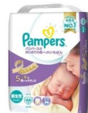
「パンパースのはじめての肌へのいちばん *1 (テープ)」 サイズ：新生児、S、M、L