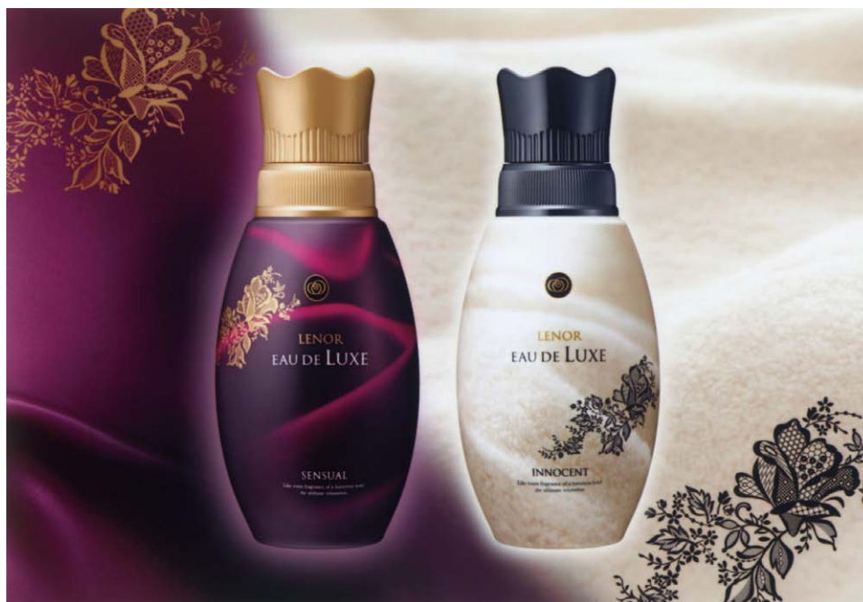
「レノアオードリュクス」(左:同 センシユアル/SENSUAL 右:同 イノセント/INNOCENT)

パリに実在する高級ブティックホテル「ル・パヴィヨン・ドゥ・ラレーヌ」において、大切なゲストへのおもてなしとして実際に使われている香りで、ファブリックを“お手入れ”するという新発想をご提案します。女性的で繊細な香りの「イノセント」と、官能的で上品な香りの「センシユアル」の2種類の香りの展開です。