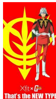
【壁紙】スマートフォン用