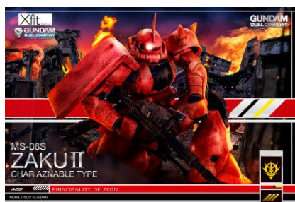
【オリジナルカードダス】

キャンペーンサイト内にて、Xfitの通常パック表面に貼付されているキャンペーンシールのシリアルコードを入力すると、全員に PC・スマートフォン対応のオリジナル壁紙をプレゼント。また抽選で豪華賞品もプレゼントします。デザインは、すべて今回のために描き下ろした、ここでしか手に入らないオリジナルです。