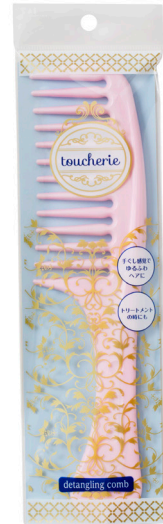
toucherie ハンドコムL 粗目 ¥600(税抜)