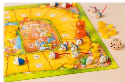
「ねことねずみの大レース」