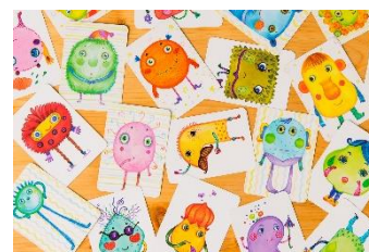
「ナンジャモンジャ」