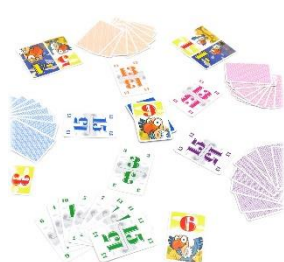
「ハゲタカのえじき」

展覧会で紹介したゲームを販売します。展覧会の入場券を提示すると、ボードゲームが5%割引で購入いただけます。