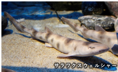
サラワクスウェルシャーク