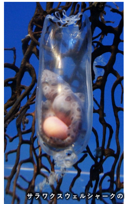
サラワクスウェルシャークの