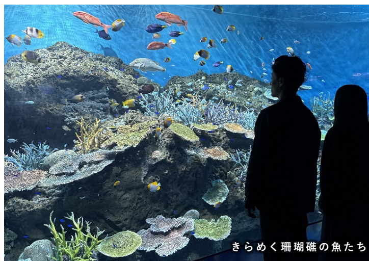
きらめく珊瑚礁の魚たち

当水槽は、学生時代に沖縄でフィールドワークをおこなっていた担当飼育員の「珊瑚礁が広がる海岸で、色とりどりの小さな魚たちが群れとなって泳ぐ美しい環境を再現したい」という強い想いのもとで構成され、2022年に登場いたしました。それ以降も、より再現度を高めるために数々のバリューアップを行ってまいりましたが、今回は新たに水槽内に水流をつくり、複雑な潮の流れが生じる自然環境に近づけたことで、より生き生きとした魚たちの動きが見られるようになりました。また、増設した擬サンゴの周りには多くのスズメダイの仲間たちが群れを成しており、自然界での行動・生態を再現しています。