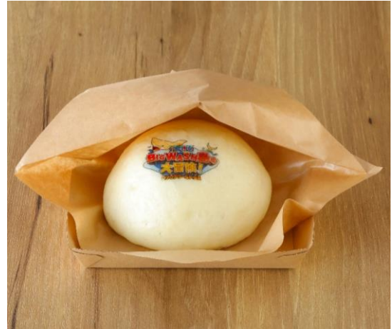
BIG WASH 島名物!! サメまんじゅう 価格：550 円

皮付きフライドポテト・サメフライにオリジナルのイラスト入りコロッケを加えたアソートセット。 オリジナルボックスはメインビジュアルがデザインされています。