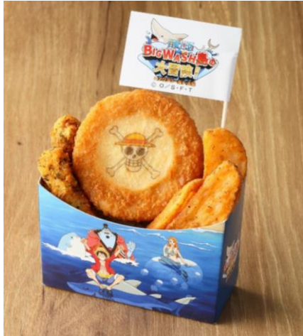
BIG WASH 島特製 フライセット 価格：700 円

ここでしか食べられない BIG WASH 島限定のオリジナルグルメをぜひご堪能ください。