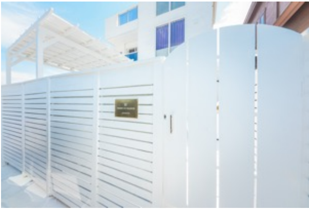
玄関エントランス