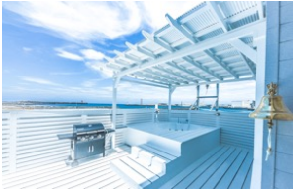
BBQもできるジャグジー テラス