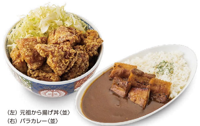
(左) 元祖から揚げ丼<並> (右) バラカレー<並>

さらに全メニューのテイクアウトもご用意、ご自宅や会社などお好きな場所で当店自慢の味をお楽しみいただけます。