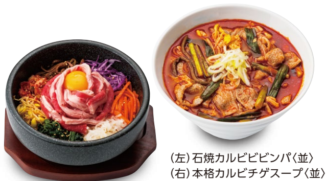
(左) 石焼カルビビビンパ〈並〉 (右) 本格カルビチゲスープ〈並〉