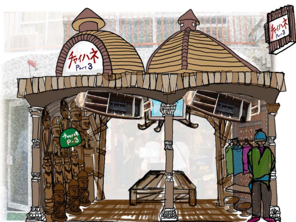
「チャイハネ Part3」完成予定図

エスニックファンならずとも、ワンポイントとして個性的な柄を取り入れたい方へのニーズにもお応えいたします。