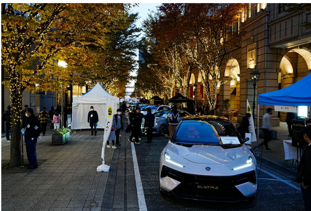
関西屈指の港町・神戸に電気自動車が集結！ クリスマスディスプレイで飾られた街を試乗できる