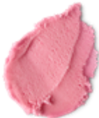
NEW スノーフェアリー ボディスクラブ (ボディスクラブ) ¥2,200(税込) / 135g ¥4,400(税込) / 290g