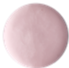
NEW グローフェアリー (シャワージェル) ¥1,800(税込) / 110g ¥3,600(税込) / 280g ¥6,380(税込) / 560g