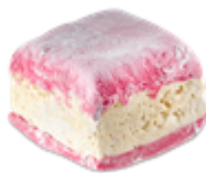
NEW クリスマスミンティ デイライト (ボディウォッシュ) ¥1,280(税込) / 100g