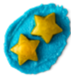
NEW シュートフォースターズ ボディスクラブ (ボディスクラブ) ¥1,800(税込) / 100g ¥3,600(税込) / 250g