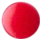
NEW スノーフェアリーグリッター (シャワージェル) ¥1,720(税込) / 110g ¥3,550(税込) / 280g ¥6,100(税込) / 560g

ラッシュのスノーフェアリーがいないクリスマスなんて考えられない！この甘いキャンディの香りが冬の風物詩のひとつであることは間違いありません。全7種のうち5種がスノーフェアリーレンジとして登場。これまで世界中のラッシュファンを魅了し続けてきたアイコン的なピンクで綿菓子のように甘いシャワージェルに、オリジナルバージョンの13倍ものラメが入ったアイテムや日中に光をチャージさせておくことで暗闇でほのかに光るアイテムなど、4種のキラキラ輝くシャワージェルが加わりました！シャワージェルは豊かな香りで全身を洗いあげるボディソープで、顔、体、髪と全身にお使いいただけます。