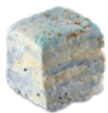
NEW ザナイトピヴォークリスマス デイライト (ボディウォッシュ) ¥980(税込) / 100g

クリスマスを彷彿させるデザインの全9種のソープアイテムに登場するのは、まるでマシュマロのようなふわふわ新感覚のボディウォッシュ2種でふわふわのテクスチャーが特徴です。ソープは、石ケン素地にパームオイルを使用していません。