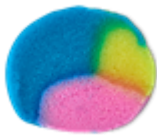
NEW インターギャラクティック ボディスクラブ (ボディスクラブ) ¥2,400(税込) / 100g ¥4,800(税込) / 290g

バスボムで大人気の『インターギャラクティック』や、ラッシュの冬の定番『スノーフェアリー』『シュートフォースターズ』がボディスクラブになって登場。バスマルツは、入浴料としてお風呂に溶かしていただく使い方とアロマウオーマーにセットしてお使いいただく2通りの使い方ができるユニークなアイテムで、どちらもエッセンシャルオイルの芳醇な香りを楽しんでいただけます。