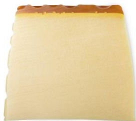
みつばちマーチ (ソープ) ¥870(税込) / 100g

お肌をいたわる保湿効果に優れたハチミツを配合した、お肌を優しく洗い上げるソープ。温かみのある優しい香りを醸し出すベルガモットとスイートオレンジが健やかなお肌に導き、ハチミツとアロエベラが潤いを与えて乾燥を落ち着かせます。ハチミツ いっぱいのお肌に「すべり落ちてしまった」と錯覚するほどのグルマン系の濃厚な甘さの香りです。(商品ページ)