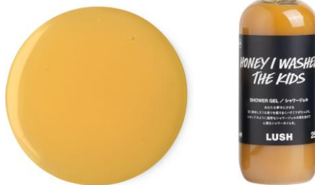
みつばちマーチ シャワージェル (シャワージェル) ¥1,330(税込) / 100g ・ ¥2,650(税込) / 250g ¥4,550(税込) / 500g ・ ¥7,400(税込) / 1000g

お肌をいたわる保湿効果に優れたハチミツを配合した、お肌を優しく洗い上げるソープ。温かみのある優しい香りを醸し出すベルガモットとスイートオレンジが健やかなお肌に導き、ハチミツとアロエベラが潤いを与えて乾燥を落ち着かせます。ハチミツ いっぱいのお肌に「すべり落ちてしまった」と錯覚するほどのグルマン系の濃厚な甘さの香りです。(商品ページ)