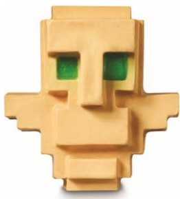
トーテム ¥1,500 (税込) / 75g (ソープ)

森の洋館にいる邪悪な村人・エヴォーカーから入手した秘密のレシピで作られたソープは、保湿効果を発動し、あなたのお肌を乾燥の危機から守ります。スイートオレンジとベルガモットをブレンドしたキャラメルのような甘い香りは、ラッシュのロングセラーソープ『みつばちマーチ』と同系統です。明るい香りを全身にまとい、新しい一日を迎え、元気に冒険を再開しましょう！