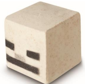
スケルトン ¥800 (税込)/個 (シャワーボム)

長い冒険の一日、太陽が沈んだら、香り高いシャワーへテレポート。シャワーボムに少量の水を掛けると(目を合わせないように注意して!)、紫色のムース状の泡が出現します。ラベンダーとカモミールオイルの香りを深く吸い込みながら、泡と一緒に今日一日を洗い流しましょう。