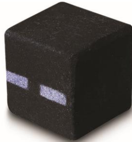
エンダーマン ¥800 (税込)/個 (シャワーボム)

ゲームの中でプレイヤーに自爆攻撃を仕掛ける危険なモンスター・クリーパー。今回のコラボレーションアイテムでは、水分を含ませると形が変わっていき、モコモコとあふれる緑色のムース状の泡とレモングラスの爽やかな香りで全身を洗浄します。