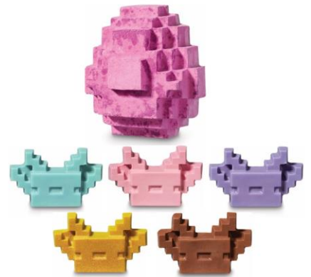
ウーパールーパーのスポンエッグ ¥2,500 (税込) / 個 (バスボム)

ツルハシを構え、振り回してふわふわな泡を立てたら、パチヨリとシナモンリーフをブレンドした落ち着いた香りが広がります。ダイヤがなくなるまで繰り返し使える泡風呂が作れるリユーズバブルタイプのバブルバーです。