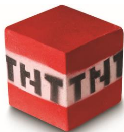
ティーエヌティーブロック ¥800 (税込)/個 (バスボム)