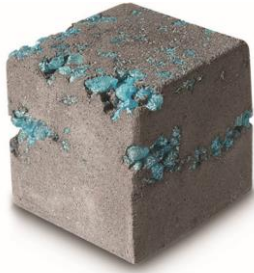
ダイヤモンド鉱石 ¥800 (税込)/個 (バスボム)

シーソルトがお肌を柔らかく整えるバスボムです。ブラックカラントとベルガモットをブレンドした甘い香りは、あなたを優しく包み込んで、ネガティブな雰囲気から守ってくれるでしょう。