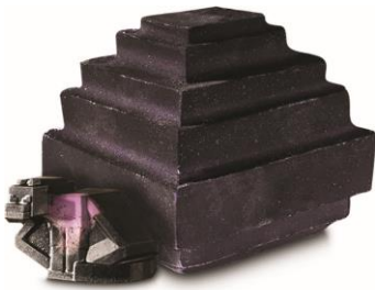
エンダードラゴンのスポンエッグ ¥3,000 (税込) / 個 (バスボム)

ジャイアントサイズのこのバスボムがあれば、バスタブに飛び込んで、キラキラ輝くバスタイムの新しいディメンションを冒険したくなるでしょう。バスボムを溶かすと中から、エンダードラゴン(ソープ)が出現します。バスボムは、一度に全部お湯に溶かすもよし、数回に分けて使うもよし！楽しみ方はあなた次第です。おいしいローズジャムをイメージしたローズとレモンの香りが広がります。