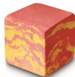
溶岩ブロック ¥800 (税込)/個 (バスボム)

ジャスミン、イランイラン、クラリセージの穏やかな香りが赤と白の泡とともに広がる中、弾けるポッピングキャンディの音をゆっくりとお楽しみください。