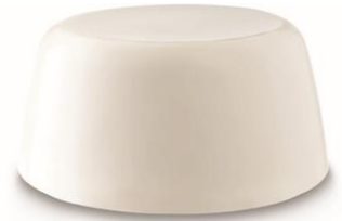
ミルク入りバケツ ¥1,600 (税込)/100g (シャワーゼリー)

ベストセラーバスボムの『インターギャラクティック』をキューブ型にしました。グレープフルーツとペパーミントのフレッシュな香りは、忙しい毎日を乗り切るサバイバルモードからリラックスモードへ気持ちを切り替える時に大活躍！