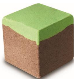
草ブロック ¥800 (税込)/個 (バスボム)