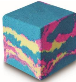
インターギャラクティック ブロック ¥800 (税込)/個 (バスボム)

シーソルトがお肌を柔らかく整えるバスボムです。ブラックカラントとベルガモットをブレンドした甘い香りは、あなたを優しく包み込んで、ネガティブな雰囲気から守ってくれるでしょう。