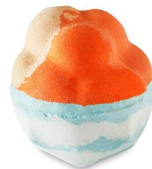
チェルシーモーニング ¥1,300(税込)

カラフルな渦まきが水面に広がり、芸術作品のようなバスアートを描くバスボムです。見た目も誰が見ても楽しめるようにデザインされています。チャンパカアブソリュートのキャラメルがかったような、フローラルな香りとオーガニックスイートオレンジオイルの晴れやかで少し酸味のある香りのブレンドです。