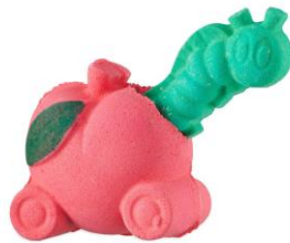
フルーツアデイ ¥1,580(税込)

大好物のトウモロコシをモチーフにしたマシンに乗るアナグマのバスボムは、子どもはもちろん、童心を忘れない大人にもおすすめです！本物のトウモロコシから搾ったコーンオイルが保湿のために配合されています。スイートオレンジ、ローズ、ベンゾインをブレンドした明るい印象を与えるシトラスフルーティーノートの香りです。(公式オンラインストアにて4月27日以降順次発売)