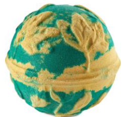
ドルイドオブバス ¥1,180(税込)

お肌の調子を整えると共に、香りで気分の上がるレモングラスが配合されたバスに乗ってバスルームを旅しませんか。甘くてスパイシー、力強さもあるウッディな香りのコリアンダーオイルを含んでいます。ビタミンEが豊富でお肌に潤いを補給してくれ、やわらかで滑らかな状態へと導くアルガンオイルも配合しています。