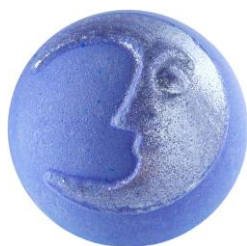
ブラザームーン ¥1,180(税込)

日本チームが考案した新商品。お湯に溶かせば、パチパチとポッピングキャンディが弾ける音とバスタブの中を虹色に染めていきます。ココナツミルクパウダーが肌を保湿。マンダリンとレモンが放つ柑橘の爽やかさと、ベルガモットとオレンジフラスの甘く優しい香りが広がります。