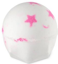
アメリカン・クリーム ボム ¥850(税込)

お湯に反応してバスボムの色が変わっていくアイテムです。ラッシュショップから漂ってくる香りを再現したバスボムで至福のバスタイムを心ゆくまで楽しみましょう。お湯に溶かした瞬間は、レモンとライムの爽やかな香り。やがて、あたたかみのあるトンカの甘さと優しいフローラルノートに、シャープでフルーティーな香りへと変化していきます。