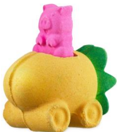
ピッグインアポーク ¥1,580(税込)

日本チームが考案した新しいバスボムは、「夏祭りの金魚」をイメージして作られました。パチパチキャンディの弾ける音は、日本の夏祭りや花火を思い出させます。ベルガモットオイルの気分をスッキリさせる爽快な香りとラベンダーアブソリュートの穏やかな香りのブレンドです。