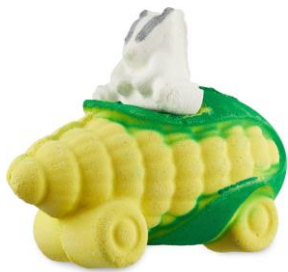
ビートザクロックバジャー ¥1,580(税込)

各店舗がセレクト(キュレーションシステム)し販売するため、店舗により販売するバスボムの種類は異なります。