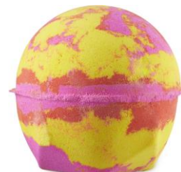
トロピカルレッド ボム ¥990(税込)

小児がんのチャリティ団体「アリスズ・アーク」の「デクスターズ・アーク基金」に本商品の全売上げ(消費税を除く)を、動物実験を行わない横紋筋腫の研究のために寄付。詳しくは公式オンラインストアをご確認ください。水蒸気蒸留法で抽出されたクローブ蕾オイルは香りに温かみを加え、お肌を健やかに保ち、爽快で刺激的な香りのライムオイルが気分を上げてくれます。