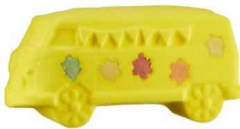
マジックバス ¥800(税込)

大好物のパイナップルをモチーフにしたマシンに乗るブタの遊び心溢れるバスボムです。ブタの部分は、ゼラニウム、フランキンセンス、ベルガモットをブレンドした甘い香り。パイナップルの部分は、スイートオレンジ油やコリアンダー種子油、インドレモングラス油をブレンドしたとてもフルーティーでトロピカルな香りです。(公式オンラインストアにて4月27日以降順次発売)