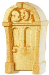
29 アイコニックドア ¥990(税込)

お湯に反応してバスボムの色が変わっていくアイテムです。ラッシュショップから漂ってくる香りを再現したバスボムで至福のバスタイムを心ゆくまで楽しみましょう。お湯に溶かした瞬間は、レモンとライムの爽やかな香り。やがて、あたたかみのあるトンカの甘さと優しいフローラルノートに、シャープでフルーティーな香りへと変化していきます。