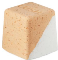
コールドウォーターソーザー ¥1,200(税込)

イギリス・チェルシーの朝を歌った曲からインスピレーションを得たバスボムは、「バタースコッチのように太陽の光が降り注ぐ」という歌詞からとるような甘い香りが誕生しました。レモンマートル、トンカ、パニラをブレンドしてバタースコッチのホッと甘い香りを再現しました。