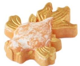
ゴールドフィッシュ ¥850(税込)

大好物のリンゴで作ったマシンに乗るアオムシのバスボムは本物のリンゴ果実が健やかなお肌を保つために配合されています。ベルガモット、ローズ、ネロリのブレンドが、リンゴのフルーティーな香りを際立たせ、お肌にまとわせませす。