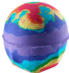
サーマルウェーブス ¥1,180(税込)

お日さまとお月さまという童話から着想を得て作られたバスボム。シャープでありながらもフレッシュなハーブを思わせる香りに、爽やかなグレープフルーツと気分を落ち着かせバランスを整えてくれるローズオイルのフローラルな香りです。