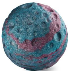
アステロイド (バスボム) ¥980(税込)/個