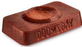
ドゥームズ・デイ (ソープ) ¥980 (税込)/ 100g

スクラブ入りの数量限定ソープ『ドゥームズ・デイ』は乾燥した砂漠が広がる映画『アステロイド・シティ』にちなんで、本物の砂を配合。古い角質を除去して汚れを落とすサポートをしながら、肌触りを柔らかくすめらかにします。ブラックカラントの甘くフルーティーな香りの石鹸を泡立てていると、シトラスノートやウッディノートもふんわりと漂います。何度も体験したくなる複雑な香りとの出会いは、あなたに隕石衝突くらいのインパクトを与えるかもしれません。