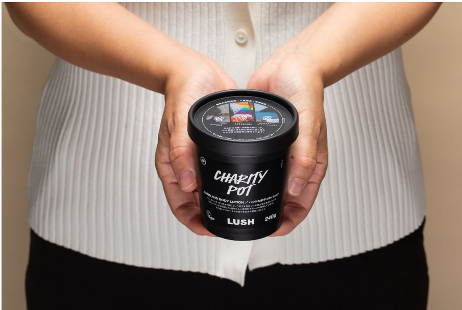
15周年を記念した新ラベルの『チャリティポット』

英国発のナチュラルコスメブランドLUSH(ラッシュ)は、2007年から定番商品として発売しているハンド＆ボディローション『チャリティポット』の15周年を記念して商品ラベルのデザインを刷新します。新ラベルは、助成団体を紹介する役割を果たし、一人でも多くのお客様に団体の存在や社会課題への興味に繋げることを目的に、日本で販売する商品を対象に2022年9月上旬より順次切り替わる予定です。