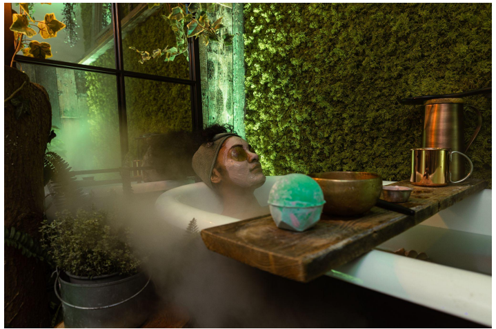
※『BOOK A BATH』入浴体験イメージ

部屋に入室すると一面には豊かな緑と可憐な花々の世界観が広がります。イギリス湖水地方の心地よい静けさにインスピレーションを受けて作られたバスボム『レイクス』から着想を得た空間へ誘います。青々とした香りのシベリアモミ油とハチミツのような香りのオスマンサスアブソリュートが、自然の中で深呼吸をした時のようなリフレッシュした気分。『レイクス』を溶かしたお湯に身をゆだね湖畔の草木をそよぐ心地良い風を想像すれば、都会の喧騒から離れて自然の中にいるような気分になることでしょう。マッサージへの究極の導入体験としてこの体験をトリートメントと組み合わせれば、ご自身を甘やかすスパ体験をよりリラックスできるひと時を味わうことができます。