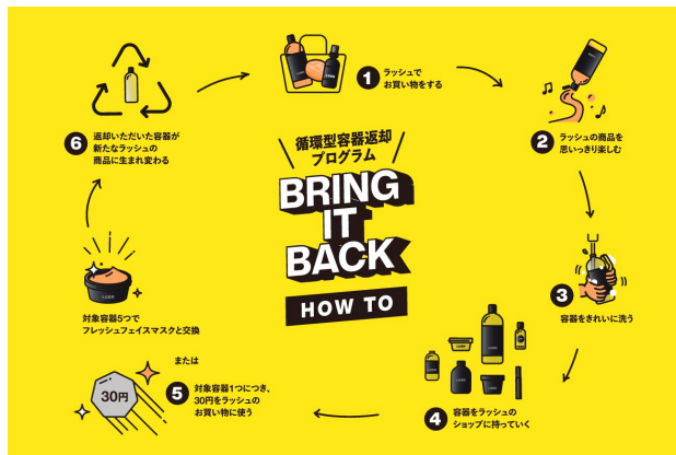
BRING IT BACKの利用方法