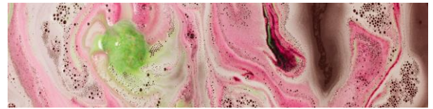
ロード オブ ミスルール (バスボム)