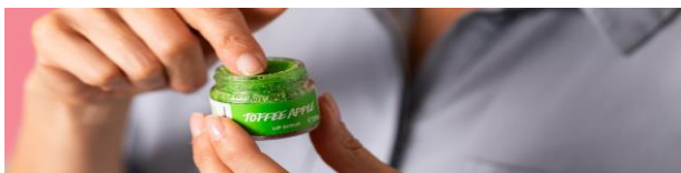
タフィー アップル (リップスクラブ)