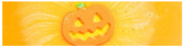
パンキン ナンキン (バスボム)