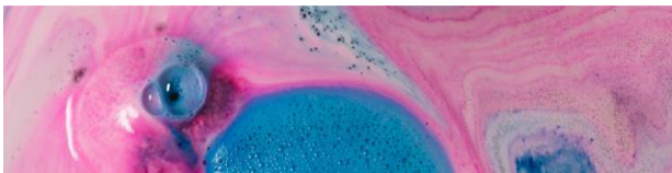
モンスターズ ボール (バスボム)