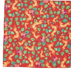
ワンス アポン ア クリスマス ノットラップ (47cm × 47cm)

野うさぎがあなたの大切な思いを伝えるために森の中を駆け巡っています。再生ペット素材から作られた温かみのある色彩のノットラップは、ヘアアクセサリとしてもおすすめです。