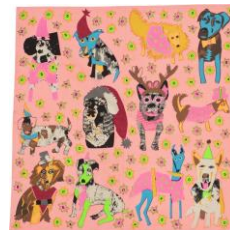
ウウフ！ ノットラップ (50cm × 50cm)

犬を今すぐ飼いはじめるのは難しいですが、このオーガニックコットン100%で作られた可愛い子犬でいっぱいノットラップならすぐに願いを叶えます。スカーフとして楽しめばいつも一緒！