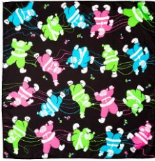
クリスマス パーティ ノットラップ (47cm × 47cm)

Knot Wrapは、日本で古来から伝統的に使われている風呂敷にインスピレーションを受けて誕生しました。バスボム、ボディローション、ソープ、バブルバーなど何でも好きな物をラッピングしましょう。また、他には無い方法で生活のちょっとしたニーズに多様に応えてくれます。リユースできるギフトラッピングとしても、美しいスカーフとしても大活躍のKnot Wrap。ペットボトルからリサイクルされた再生ペット素材のもの、またインドの女性の就労を支援する団体RE-WRAPでつくられたオーガニックコットン100%素材など、エシカルな素材にもこだわりました。贈る相手にぴったりのアイテムを選んで包めば、世界に1つだけのプレゼントの出来上がり。