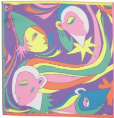
ハーレクイン ノットラップ (47cm × 47cm)

ハーレクインたちは過剰なラッピングを不思議に感じているようです。再生ペット素材から作られたノットラップなら、繰り返し使えてアクセサリとしても楽しめるのにね！