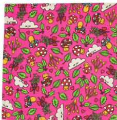
ファン ガイズ ノットラップ (50cm × 50cm)

みんなを陽気にするためにファニーなマッシュルームが大勢やって来ました！ユニークな柄で一目置かれること間違いなしのノットラップはインド産のオーガニックコットン100%です。