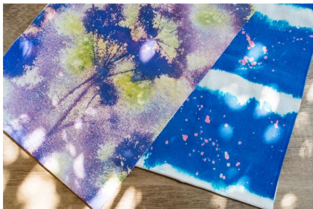
オーガニックコットンを使用した手ぬぐい2種

英国を拠点とし、世界49の国と地域でビジネスを展開する化粧品ブランドLUSH(ラッシュ)は、いわきおてんとSUN企業組合(以下、おてんとSUN)が運営する「ふくしまオーガニックコットンプロジェクト」として福島県いわき市で栽培されたオーガニックコットンを使用し、手ぬぐいアイテム2種「シーブレス(Sea Breathe)」および「スプリングシャドウ(Spring Shadow)」を2018年3月9日(金)より、日本全国約90店舗およびオンラインストアで販売する予定です。また、新たな取り組みとして、同コットンの収穫後に出る乾燥した茎を粉砕し作られたコットンペーパーを、今年2月16日(金)より発売中のラッシュのギフトアイテムの包装紙として使用しています。