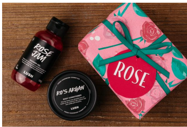
コットンペーパーを包装紙に使用したギフト「ローズ」