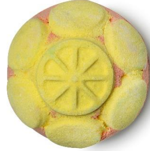
マーマレード ¥ 900 (税込)

イギリスの魔法使いの物語からインスピレーションを受けて作られたダークアーツ(黒魔術の意味)。マグル達にいじめられた吸魂鬼が部屋にいる気配がしたら、スパイシーなシナモンリーフオイルとアーモンドオイル、ブラジル産のオレンジエッセンシャルオイルが入ったダークアーツに手を染めてみて。蛇のように温かいバスタブへと滑り込み、スパイシーなバスボムを湯船に放つと、海藻由来のゼリーがお肌を柔らかく整えます。ゼリーがお湯一面に広がると、プラスチックフリー(天然由来)のラメが黒い渦巻きの中に現れるのと同時に、たちまちピンク色に変わります。あなただけの透明のマントに浸かりながら、ひと時の安らぎに身を委ねてみて。(※ヴィーガン対応製品)