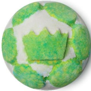
グリーンココ ¥ 900 (税込)

温かいお湯に浸かって、このブラジル産のオレンジとグレープフルーツのオイルを配合したバスボムを投げ込むと、まるで本物のマーマレードジャムに浸かって心弾む柑橘のフルーツを味見しているよう。海藻由来のゼリーがお肌の乾燥を防ぎ、お肌を柔らかく整えていくうちに、柑橘のエッセンシャルオイルにより気分が楽しい気持ちに満たされていくのをゆっくりと感じてください。鮮やかなオレンジとイエローの色合いが落ち込んだ気分を吹き飛ばし、明るく華やかな気持ちにしてくれます。(※ヴィーガン対応製品)