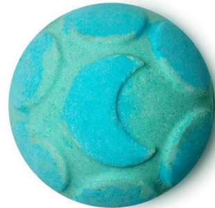
ビッグスリープ ¥ 900 (税込)

まるでココナツの木をよじ登って、とりたての大きなココナツの実をお風呂に入れているよう。海藻由来のゼリーがゆっくりとお湯一面に広がり、乾燥からお肌を守ります。また、ビタミンやミネラルを豊富に含むココナツクリームがお肌を滑らかに整えます。まるでトロピカルな南国の楽園にいるようなバスタブで、心も身体も休めてリフレッシュしてください。鮮やかなグリーンや黄緑色のマーブル状のバスアートが、心も爽やかになることでしょう。(※ヴィーガン対応製品)