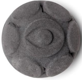
ダークアーツ ¥900 (税込)

イギリスの魔法使いの物語からインスピレーションを受けて作られたダークアーツ(黒魔術の意味)。マグル達にいじめられた吸魂鬼が部屋にいる気配がしたら、スパイシーなシナモンリーフオイルとアーモンドオイル、ブラジル産のオレンジエッセンシャルオイルが入ったダークアーツに手を染めてみて。蛇のように温かいバスタブへと滑り込み、スパイシーなバスボムを湯船に放つと、海藻由来のゼリーがお肌を柔らかく整えます。ゼリーがお湯一面に広がると、プラスチックフリー(天然由来)のラメが黒い渦巻きの中に現れるのと同時に、たちまちピンク色に変わります。あなただけの透明のマントに浸かりながら、ひと時の安らぎに身を委ねてみて。(※ヴィーガン対応製品)