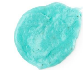
ユーージュ / Yuge ¥1,260 (税込)

ホットチョコレートからインスピレーションを受けて開発されたトリートメント。スティックにHow to useが印刷されています。