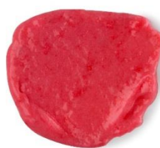
ニューホットオイル / New ¥1,260 (税込)