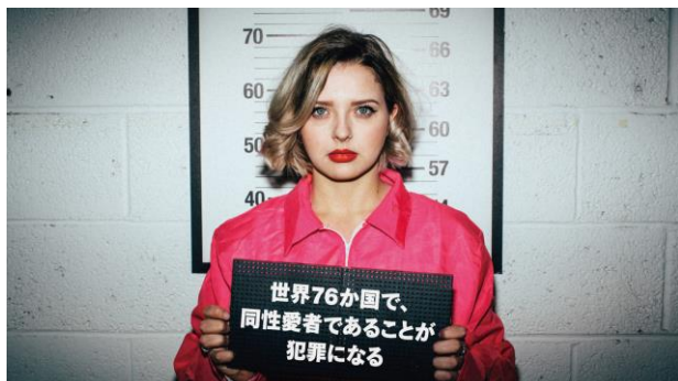
キャンペーン ビジュアル