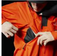
ベンチレーションポケット (高めの位置に搭載)