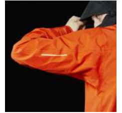
リフレクター搭載 (両腕の後方に反射プリント)