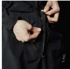
長めに設計した フロントジッパー

Price : ¥25,300 (税込) Size : XS / S / MS / M / LM / L / XL Color : Black / Gravity Grey (直営店限定カラー) Weight : 270g Material : Gore Performance Technology (Nylon 100%) 耐水性20,000mm / 透湿度30,000g/m2/24h(B1)