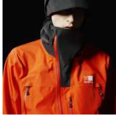
オフセットジッパー (アシンメトリーデザイン)