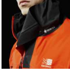
ドットボタン仕様 (パタつく襟元を固定)