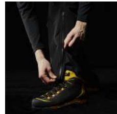
着脱時のストレスを軽減する 裾ジッパー