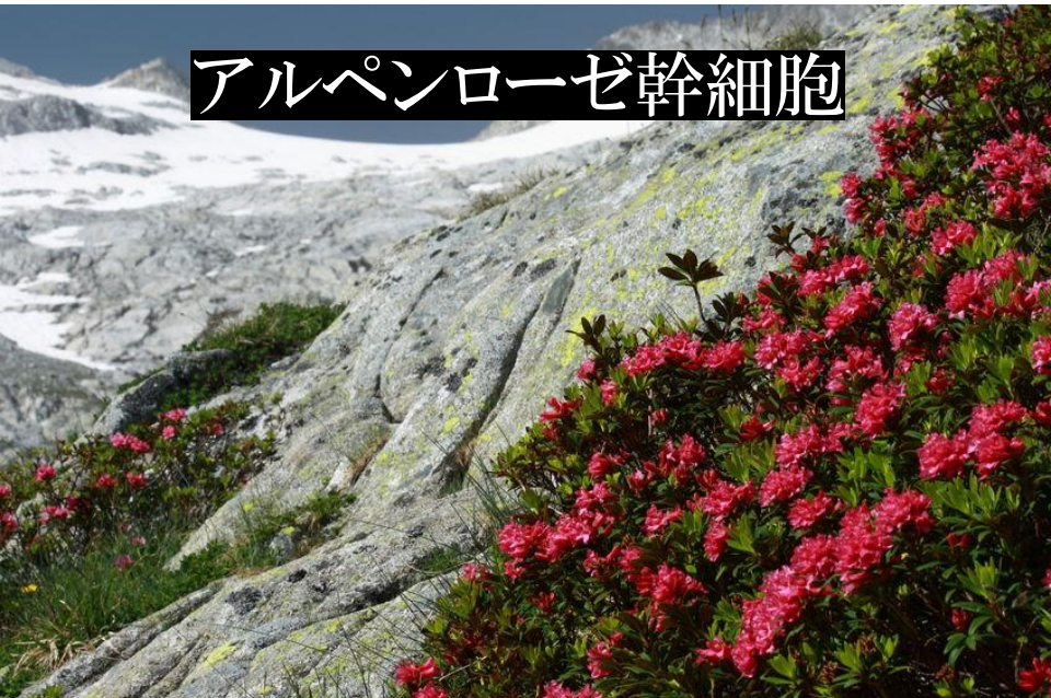
アルペンローゼ幹細胞