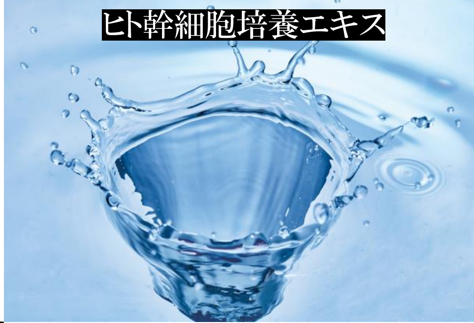
ヒト幹細胞培養エキス