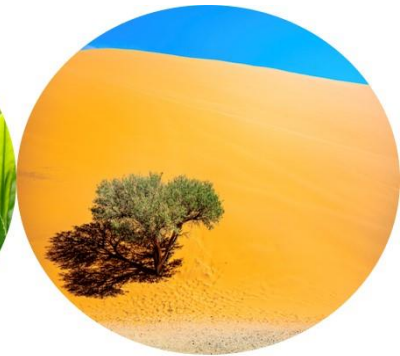
グリセリル グルコシド