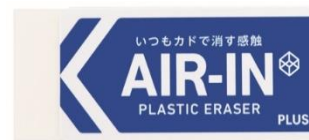
エアイン(ホワイト)

発売以来、クリエイターや消しゴム好きの方など「消し心地」にこだわる多くの皆様からご支持をいただいているロングセラー消しゴム。多孔質セラミックスパウダーとエア入りカプセルが無数のカドを生み出し、“いつもカドで消すような軽い消し心地”を実現します。