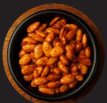
アーモンドのロースト Roasted almonds