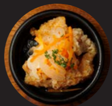
魚介の エスカベッシュ Seafood escabeche