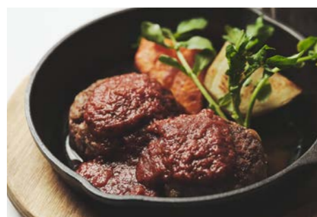
ハンバーグ 赤ワイントマトソース Red wine tomato sauce