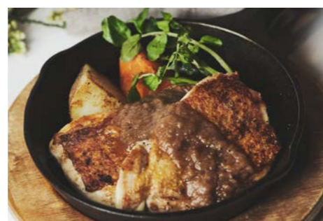
チキンステーキ Chicken steak