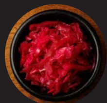
紫キャベツの マリネ Marinated purple cabbage