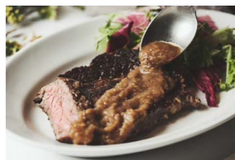
ビーフステーキ Beef steak