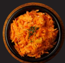
キャロットラペ オレンジ風味 Carrot Rapé with Orange Flavor