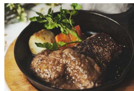
ビーフハンバーグ& ビーフステーキ Beef hamburger steak & Beef steak

全てのステーキ&コンボメニューにライス付き。ライスはおかわり無料! ソースは全てオリジナルステーキソースです。