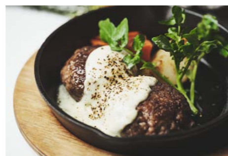
ハンバーグ 濃厚チーズソース Cheese sause

モッツアレラチーズとグラスフェッドチーズ(乳牛のミルク)を合わせた濃厚チーズソース