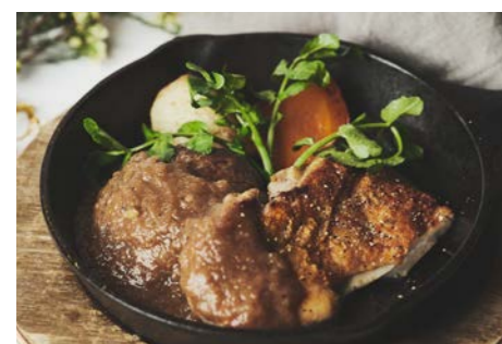
ビーフハンバーグ& チキンステーキ Beef hamburger steak and chicken steak