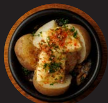
ジャガバタ Roasted potato with spicy butter