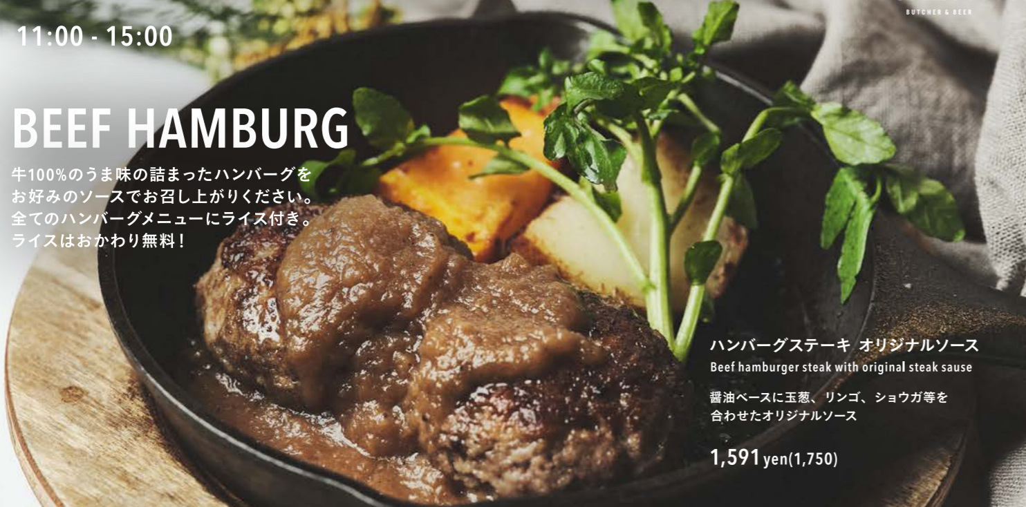
ハンバーグステーキ オリジナルソース Beef hamburger steak with original steak sauce

牛100%のうま味の詰まったハンバーグをお好みのソースでお召し上がりください。全てのハンバーグメニューにライス付き。ライスはおかわり無料!