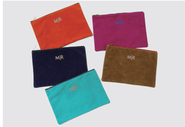
フェイクスウェードポーチ