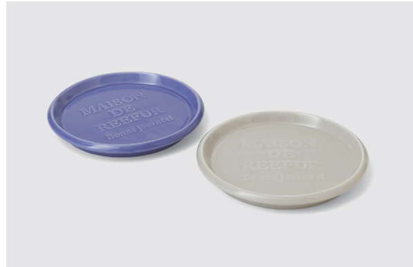
コンベックスプレート