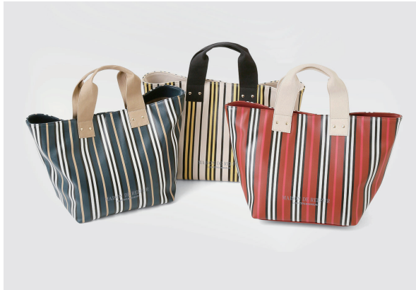
ストライプトートバッグ