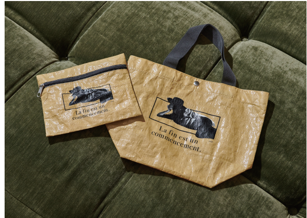
ポーチ Price : 2,900yen (+tax) Color : ベージュ トートバッグ Price : 3,500yen (+tax) Color : ベージュ