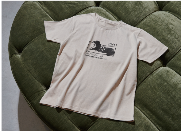
Tシャツ Price : 5,000yen (+tax) Color : ベージュ