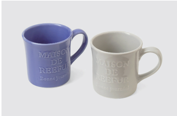
コンベックスカップ

Color : オレンジ / パープル / キャメル / グリーン / ネイビー ※9月末入荷予定