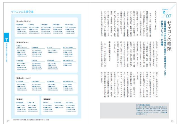
設計事務所、ゼネコン、ハウスメーカー等、基礎からわかる業界の解説記事