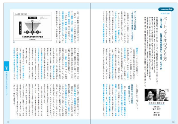
組織設計事務所の採用担当者によるポートフォリオの解説記事