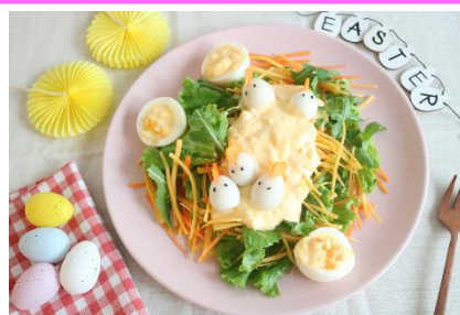
アレンジ料理 「たっぷりたまごのイースターサラダ」

「旬を味わうサラダ 金美人参ミックス」は、旬の野菜を使用した2～3人前「旬を味わうサラダシリーズ」の春季限定新商品です。「旬の野菜をおいしい時期に食べていただきたい」という思いで開発しました。冬から春にかけて旬を迎える国産の“金美人参” きんびにんじん をベースに、地中海沿岸部発祥のサラダ用ハーブ“セルバチコ”を使用することで風味を加えました。それぞれの味を引き立たせる仕上がりとなっており、グリーンとレモンイエローの暖かな色合いのサラダが食卓を春らしく彩ります。また、パッケージにはうさぎとたまごのイラストを入れ、4月4日(日)のイースターを盛り上げます。