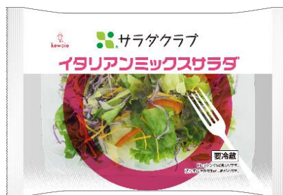
＜イタリアンミックスサラダ＞