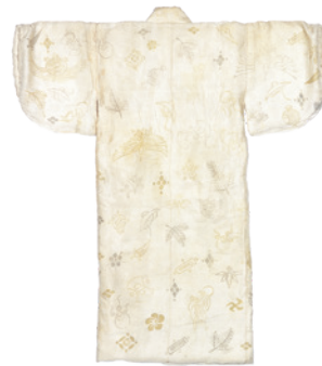
「宝尽くし文様産着」