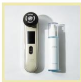
【Thaleia】 Thaleia piñon+ビタミンEムセラム 1名様

開催期間中、会場内のプレゼント🎁マークがある7ブース「味の素、オハヨー乳業、サーモス、サントリー、ゼリア新薬工業、明治、キムソヒョン ヘミレ」で【キーワード】をチェック。会場内にある二次元コードを読み取り、【キーワード】を入力してアンケートに答えると、抽選でビューティ&ヘルスケアアイテムを！ 来場してアイテムに応募しよう。