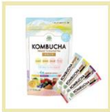
【旬台藤山製】 発酵紅茶 KOMBUCHA 4種のフルーティー味 4g×12本 5名様

※来場特典・アンケートキャンペーンは1人1点（回）まで、なくなり次第終了させていただきます。