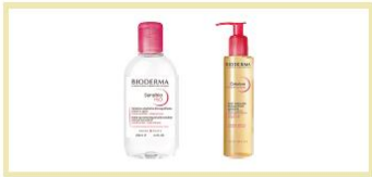
【ビオデルマ】 サンシビオ エイチウォーター D(250ml)+サンシビオ ミセラークレンジングオイルのセット 5名様