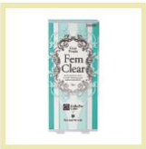
【エステプロ・ラボ】 エステプロラボ フェムクリア 10名様