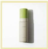
【piñon】 ビタミンEムセラム 3名様

開催期間中、会場内のプレゼント🎁マークがある7ブース「味の素、オハヨー乳業、サーモス、サントリー、ゼリア新薬工業、明治、キムソヒョン ヘミレ」で【キーワード】をチェック。会場内にある二次元コードを読み取り、【キーワード】を入力してアンケートに答えると、抽選でビューティ&ヘルスケアアイテムを！ 来場してアイテムに応募しよう。