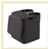
【アテックス】 マッサージツールマルチAX-HP374 1名様