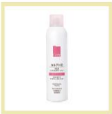
【カルテHD】 フェイス&ボディスプレー(150g) 10名様