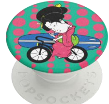
Gesiha Surfer Bike