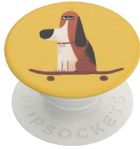
Dog on the Board