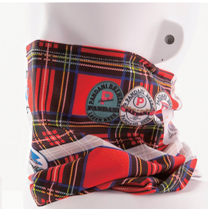
GLASGOW・Reckless ネックカバー / ホワイト