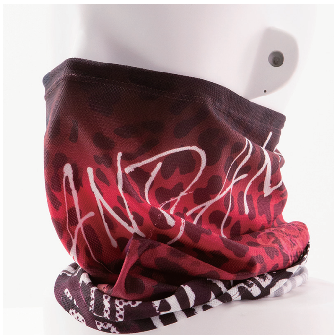
『豹100%』ネックカバー / ダークピンク