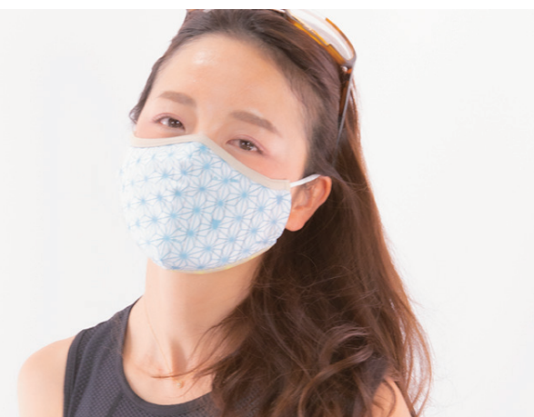
和柄xPandani Printed MASK /麻の葉