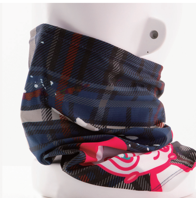
VENGA! Pandani ネックカバー / ネイビー