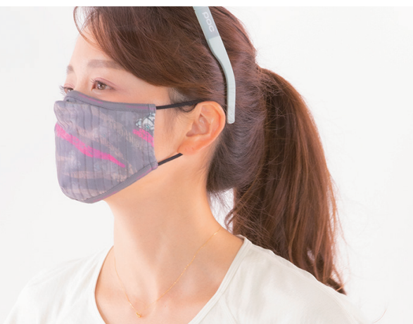
ZEBRA100%-VENGA! Printed MASK /グレー