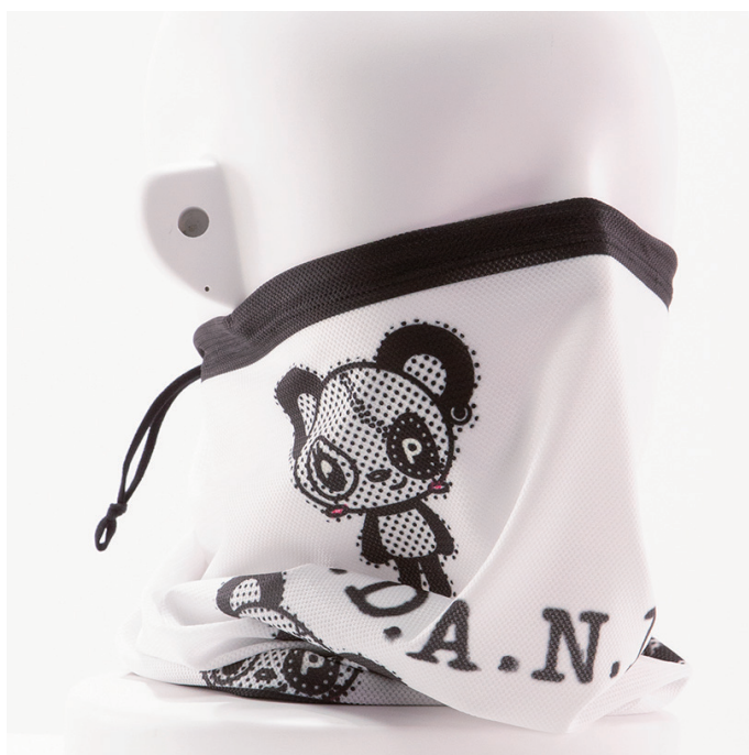
PANKYboy ネックカバー / ホワイト

ずり落ち防止として、上端に長さを調整できるゴムのストッパーが付いており、激しいスポーツシーンでのずり落ちストレスを軽減してくれる仕上がりです。筒は少し長めに設定してあり首元の日焼けが気になる方にもおすすめです。本来のネックカバーとしてのほか、頭から被ってキャップ的に使うことや、口元まで引き上げてハーフマスクのような使い方が可能です。