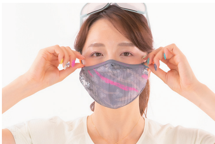
ZEBRA100%-VENGA! Printed MASK /グレー