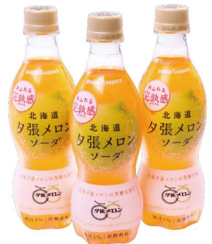
ポッカサッポロ 北海道夕張メロンソーダ