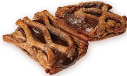
濃厚フォンダン ショコラパイ