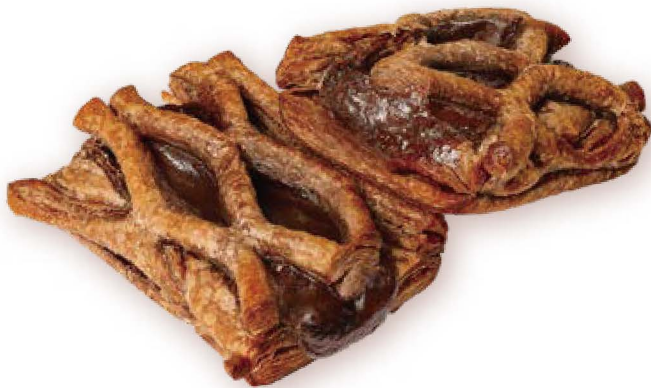
濃厚フォンダン ショコラパイ

3種のミックス4.4ピザから1枚をチョイス。 バレンタインデーにピッタリ“濃厚フォンダンショコラパイ”に“コカ・コーラミニ缶”までついて、 Mセット2,200円(税込2,376円)、Lセット2,980円(税込3,218円)のお値打ちセット。 セットおひとつからデリバリーOK。テイクアウトももちろんご利用いただけます。