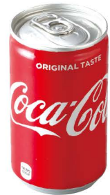
コカ・コーラ ミニ缶

3種のミックス4.4ピザから1枚をチョイス。 バレンタインデーにピッタリ“濃厚フォンダンショコラパイ”に“コカ・コーラミニ缶”までついて、 Mセット2,200円(税込2,376円)、Lセット2,980円(税込3,218円)のお値打ちセット。 セットおひとつからデリバリーOK。テイクアウトももちろんご利用いただけます。