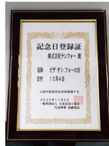
第1号店オープン日の10月4日は、 「ピザ テン.フォー」の日として、 記念日登録されています。