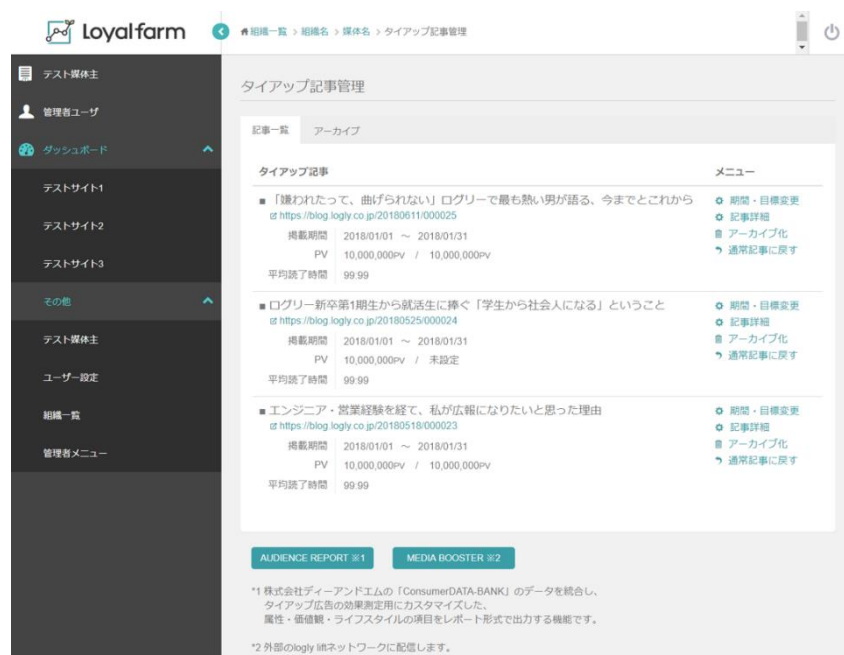
Loyalfarmタイアップ記事管理画面

例えば、化粧品に関するタイアップ広告の場合、ページビューやユニークユーザー（UU）の日次推移、ページでの滞在時間、そして閲覧状況のみならず、閲覧者の趣味や興味関心、肌に関する悩み、ダイエットへの興味や購入している化粧品それぞれの価格帯など、閲覧者のプロフィール把握に活用できるさまざまなデータを閲覧できます。これにより、ターゲットユーザーへのリーチ状況を確認することや、次のタイアップに向けての訴求点の整理、改善点の把握などについて、都度アンケート調査を実施することなく実現可能となります。