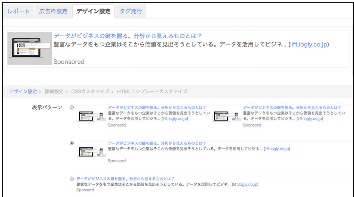
デザイン設定画面