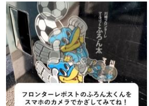
フロンターレポストのふろん太くんをスマホのカメラでかざしてみてね！