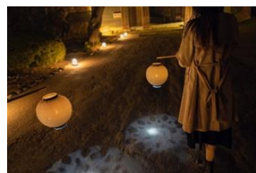
ディスタンス提灯 イメージ