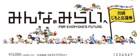
川崎じもと応援券 表紙