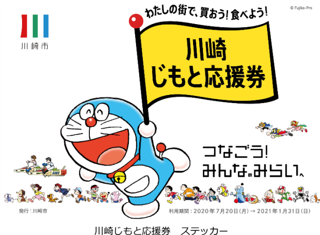
川崎じもと応援券 ステッカー

応援券には、川崎市と縁が深い「株式会社藤子・F・不二雄プロ」に全面的なご協力をいただき、ドラえもんなどのキャラクターがデザインされています。