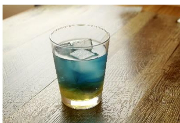
星めぐりマジックアワー