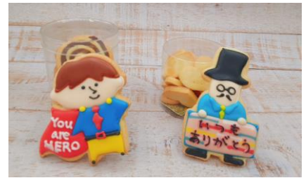
父の日クッキー（1枚648円）