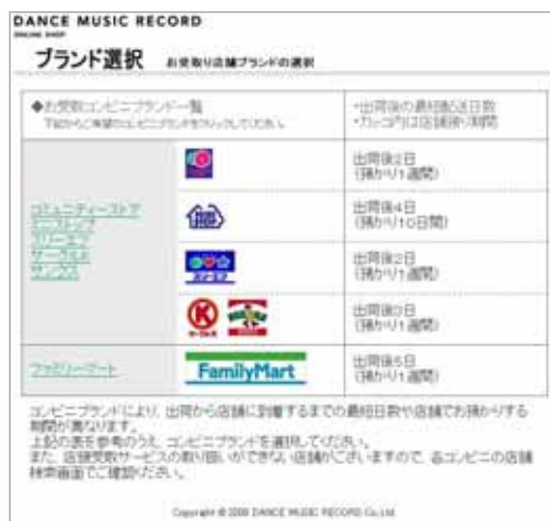
(図 2:コンビニ選択画面)