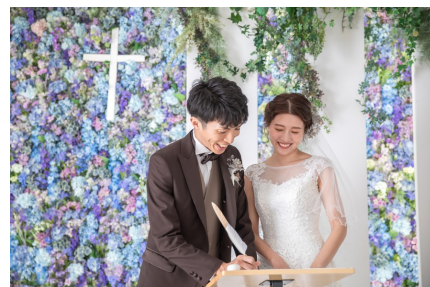
撮影イメージ：写真で挙げる結婚式

入場からベールアップ、指輪の交換、結婚証明書へのサインなどの一連の流れを、フレッシュグリーンやさわやかなチャペルスタジオで執り行い、撮影することができます。