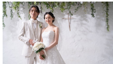
撮影イメージ：チャペルフォトプラン

厳かな雰囲気の中でおふたりの結婚の記念を残すことができます。結婚記念日の撮影や、フォトウェディングにもおすすめのプランです。